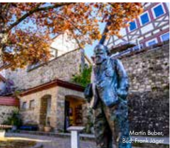
Martin Buber