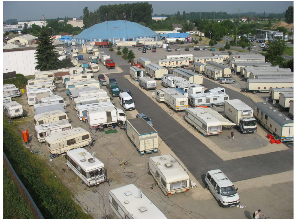
Circus Krone 2008 Ost-Seite