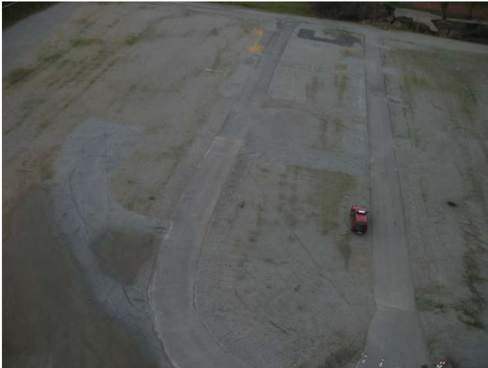
Befestigte Straßen West-Seite