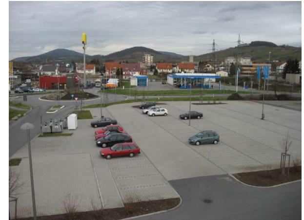
Park & Ride Platz