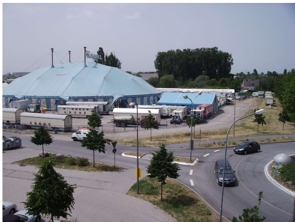
Circus Krone 2008 West-Seite