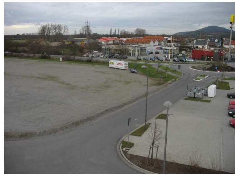
Zufahrt von B460

Für den entstehenden Abfall und die ordentliche Abfallentsorgung hat der Nutzer/die Nutzerin selbst Sorge zu tragen.